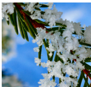
Picea abies - Fichte